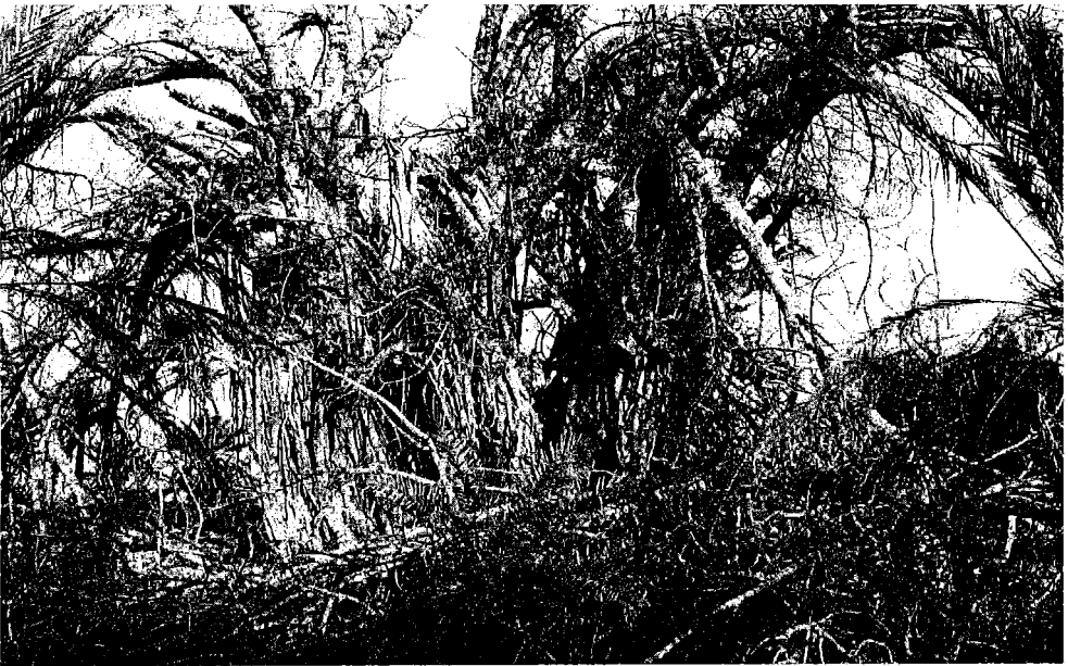
تصویر شماره ۴ : لور کهن (انجیر معابد) و دلسوخته باغ ابراهیم سالم