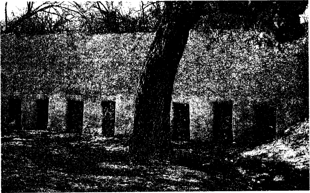
تصویر شماره ۱ : دریاچه ورودی آب باران به باغ