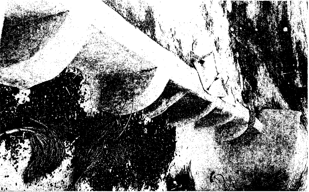
تصویر شماره ۳ : قسمتی از بند تقسیم آب باران در باغ ابراهیم سالم